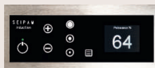
Bandeau de commande à touches sensitives et afficheur

■ Dimensions vitrocéramique : 500 x 500 mm, épaisseur 6 mm