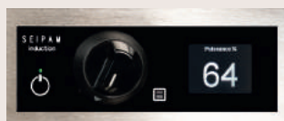
Bandeau de commande manette et afficheur