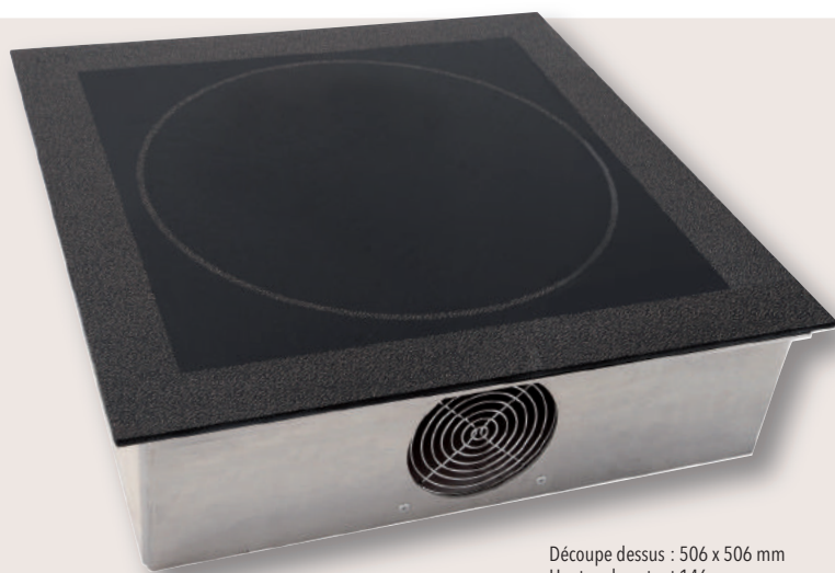
Découpe dessus : 506 x 506 mm Hauteur hors tout 146 mm