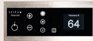
Bandeau de commande à touches sensitives et afficheur

■ Dimensions vitrocéramique : Ø 300 mm, profondeur 70 mm, épaisseur 6 mm