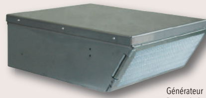
Générateur 8-10-12 kW Dim. générateur : 368 x 463 x 154 mm