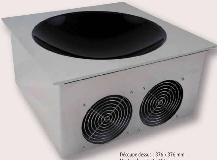
Découpe dessus : 376 x 376 mm Hauteur hors tout : 186 mm