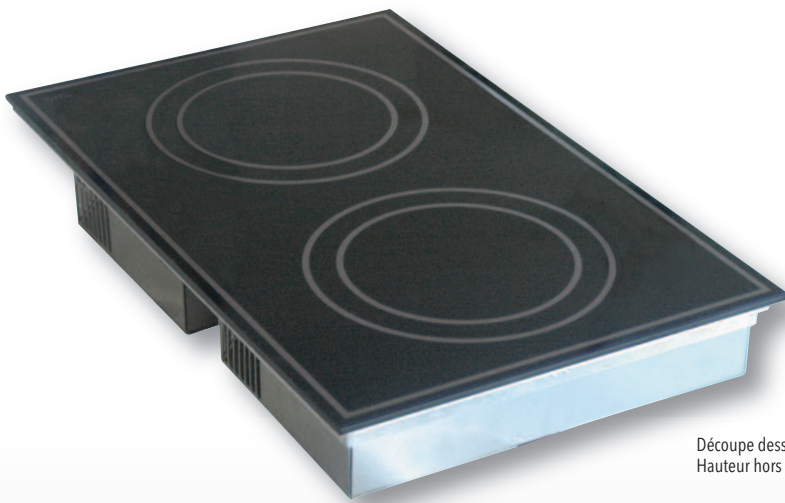
Découpe dessus : 376 x 586 mm Hauteur hors tout : 80 mm