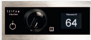
Bandeau de commande manette et afficheur (1 par feu)