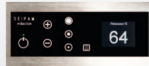
Bandeau de commande à touches sensitives et afficheur (1 par feu)