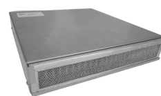
Générateur déporté avec filtre lavable intégré

L'induction invisible MAINTIEN EN TEMPERATURE comprend :