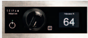
Bandeau de commande manette et afficheur