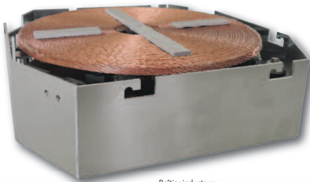
Boîtier inducteur : 252 x 252 x 73,5 mm