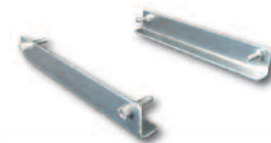
Equerres de fixation