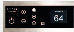
Bandeau de commande à touches sensitives et afficheur

Le kit induction EASYFIT PREMIUM comprend : un générateur déporté, un boîtier inducteur, la commande, le câblage complet et deux profilés alu à coller directement sous la vitrocéramique existante, non fournie