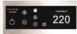
Bandeau de commande à touches sensitives et afficheur (1 par zone)