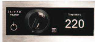
Bandeau de commande manette et afficheur (1 par zone)